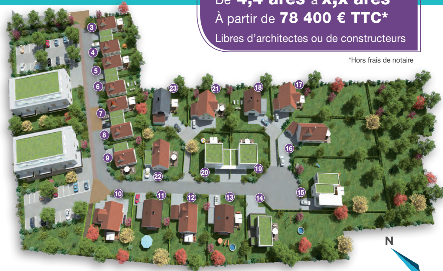
Proposition d'implantation de maisons. Photos et documents non contractuels.

Vous proposer ce qu'il y a de mieux pour votre bien !